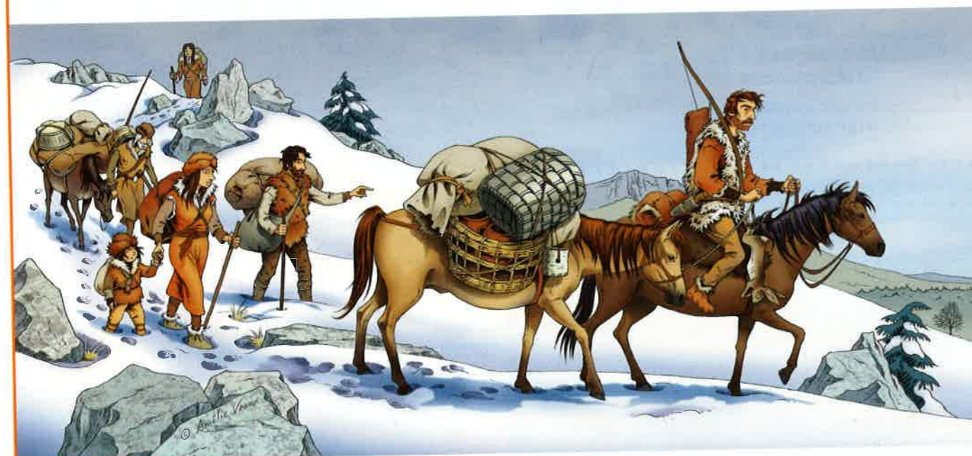
Doc 2 Le cheval comme moyen de transport