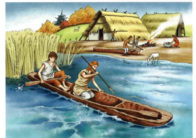
Doc 4 Le déplacement en pirogue

À la fin de la préhistoire, les hommes deviennent sédentaires et s'établissent dans des campements fixes. Ils choisissent souvent de s'installer près des lacs ou des rivières. Ils inventent alors la pirogue pour se déplacer sur l'eau et pratiquer la pêche de manière efficace.