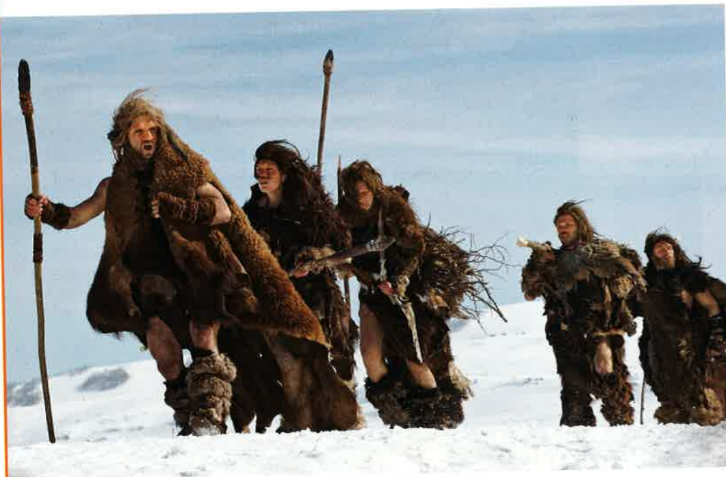
Doc 1 Le déplacement à pied d'un lieu de chasse à l'autre Image extraite du film de Jacques Malaterre, Ao, le dernier Neandertal , 2010

leurs bras ou sur leur dos. Progressivement, ils se servent de la force animale pour transporter leurs affaires. Des bêtes, comme l'âne puis le cheval et le bœuf, sont dressées pour seconder la force de l'homme.