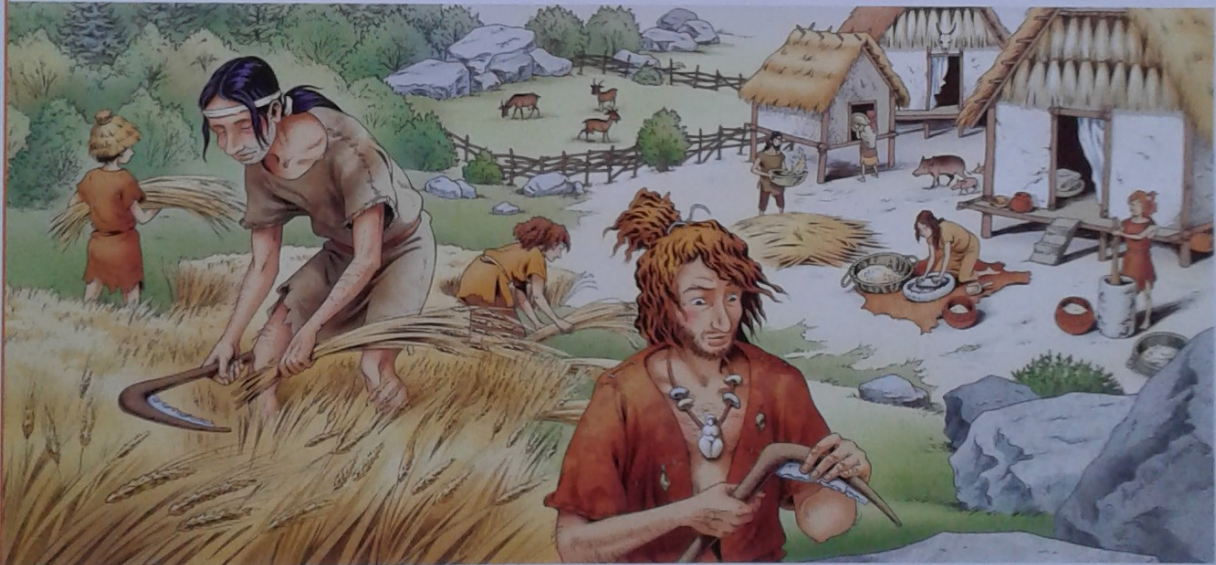
Doc 5 Le fauchage du blé et la transformation des grains en farine