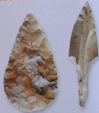
Doc 2 Des outils de chasse : un biface et une pointe de flèche