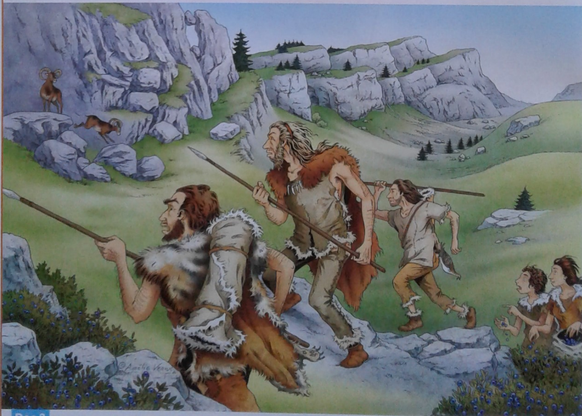
Doc 3 Une scène de chasse et de cueillette