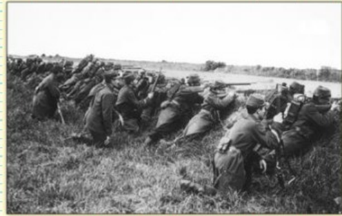
Soldats français embusqués derrière un fossé (avant la période des tranchées)

1°/Quelles sont les natures de ces documents ?