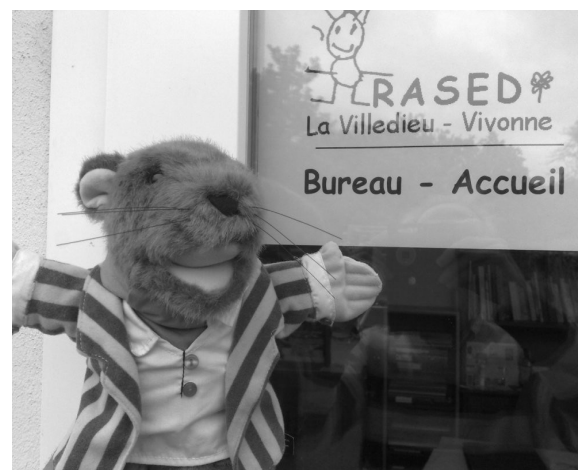
Le rat Z

Le RASED a apporté une réponse directe à 185 élèves (13% de l'effectif total) sous différentes formes (suivi en groupe ou individuel, bilan/évaluation, rencontres avec les familles, participation à diverses réunions).