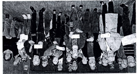
Ces Luppéens seront certainement prêts à concourir pour l'embellissement de leur commune dès les beaux jours de 2017.

Le Concours national des villes et villages fleuries et des maisons fleuries est créé et pris en charge par l'Etat en 1959, dans le cadre d'une campagne pour « fleurir la France ».