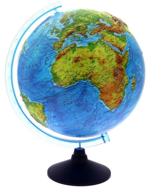
le globe terrestre