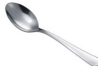
une grande cuillère