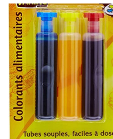
Des colorants alimentaires