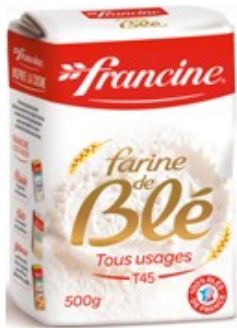
120 g de farine