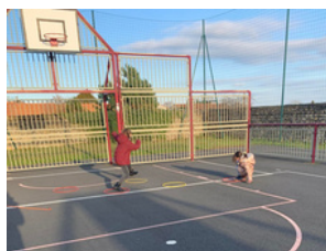
Sauter dans les cerceaux