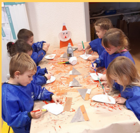
Les enfants ont peint pour faire la tête du Père Noël...