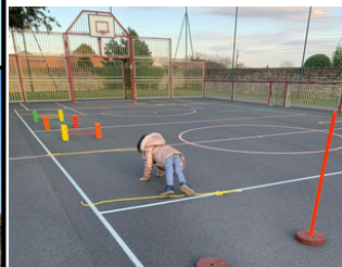
Marcher comme un ours