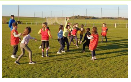
Qui aura le ballon ?