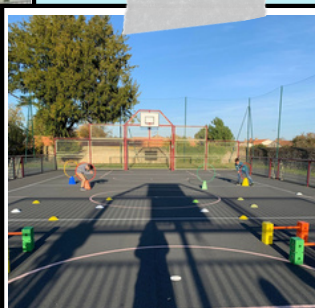
Passer dans les cerceaux

Le parcours training est un sport méconnu auprès des enfants. Celui-ci consiste à faire plusieurs exercices les uns après les autres non chronométrés