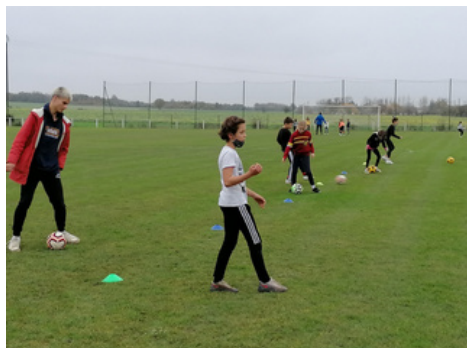
Slalomer entre les plots avec le ballon