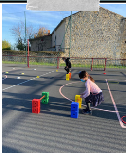
Saut pieds joints