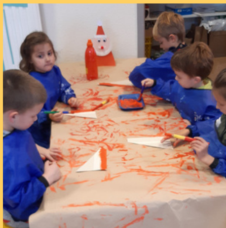
Ainsi que pour faire son costume et son chapeau rouge