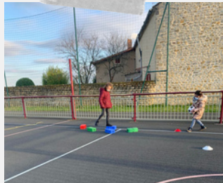
Marcher sur les plots

Le parcours training est un sport méconnu auprès des enfants. Celui-ci consiste à faire plusieurs exercices les uns après les autres non chronométrés