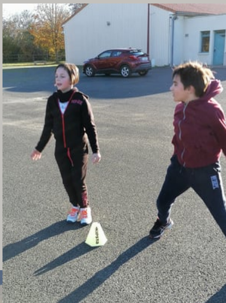
Sauts jumping jacks