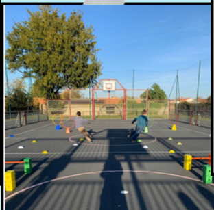
Slalomer autour des plots