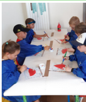
les enfants peignent le toit du moulin