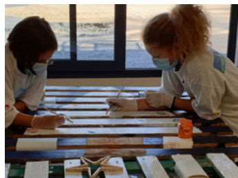
La palette prend des couleurs