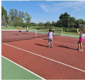
LA BALLE BRULANTE