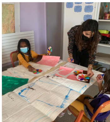
Carolina est professeur d'art plastique