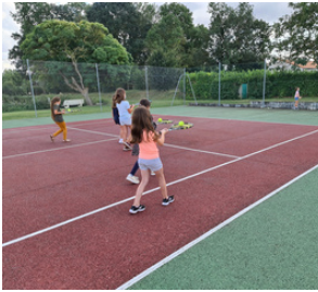
1 2 3 SOLEIL