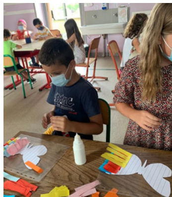
Les enfants collent des bandes de papier pour faire les ailes