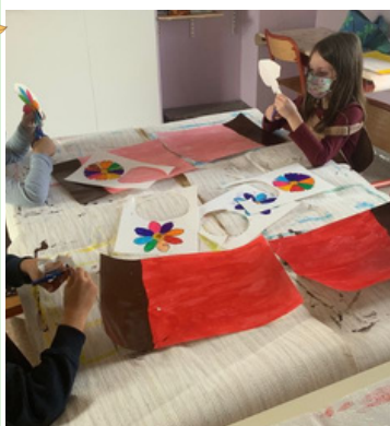
Réalisation d'un bouquet de fleurs