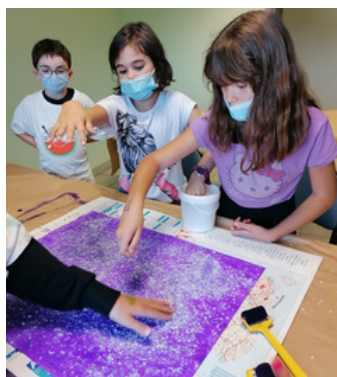
dépose de gros sel pour donner du relief