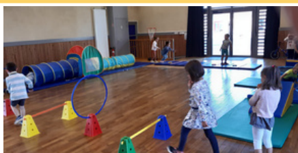
La motricité sous forme de parcours