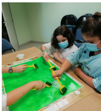
fond d'encre couleur automnale