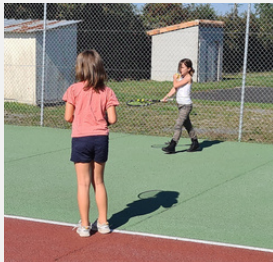
APPRENDRE À TENIR LA RAQUETTE