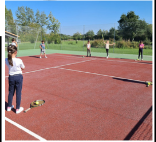
LANCER DE BALLE