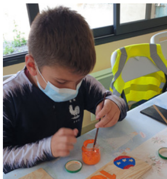
peinture sur bois