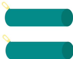
2 TROUSSES 1 pour le matériel quotidien et l'autre pour les crayons de couleur et les feutres