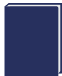
1 PORTE VUES (120 VUES)