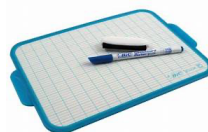
1 ARDOISE BLANCHE