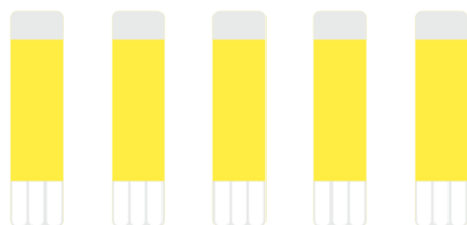
5 TUBES DE COLLE