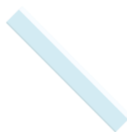
KIT DE TRACAGE