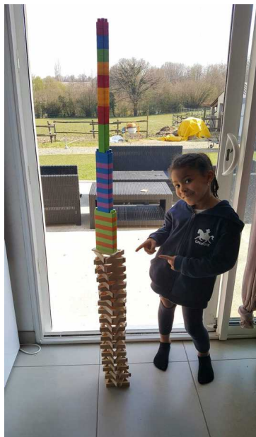
« La tour de Léna a été réalisée en duplo et mesure 1m44 ( 144 cm) »