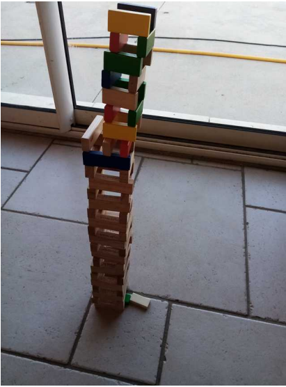
« Ma tour mesure 69 cm » Flora