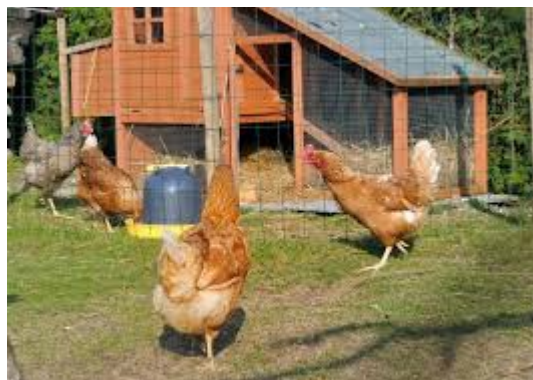
Poules et poulailler