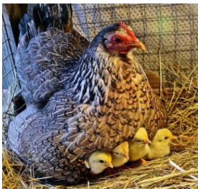
Poule et poussins

En France, 68% des poules pondeuses sont élevées en cage. De plus en plus de personnes ont des poules chez eux afin de réduire leurs déchets, ce qui est bien pour la planète.