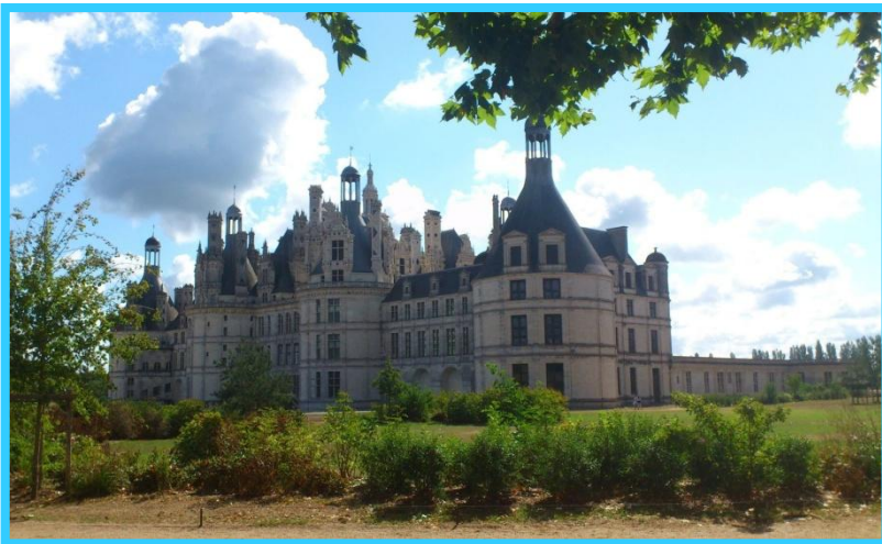
Chambord, l'un des châteaux de la Loire