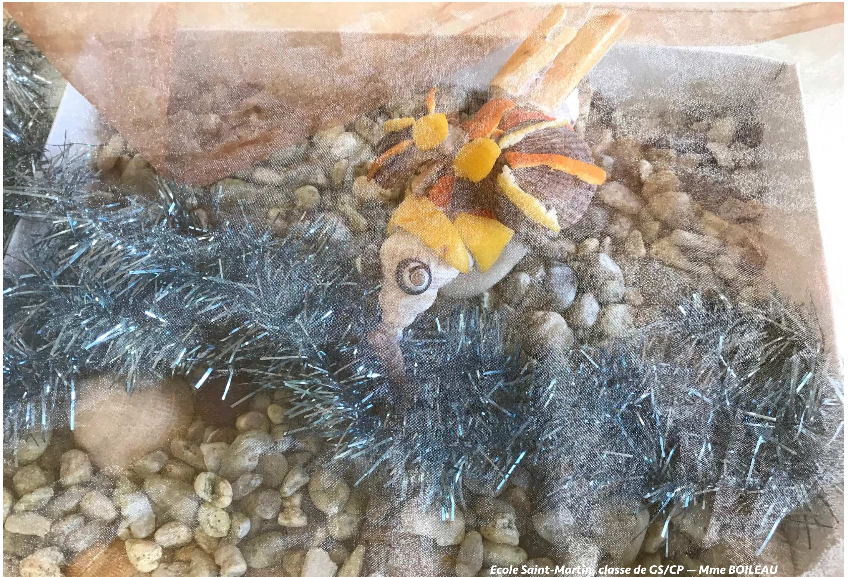
Ecole Saint-Martin, classe de GS/CP — Mme BOILEAU