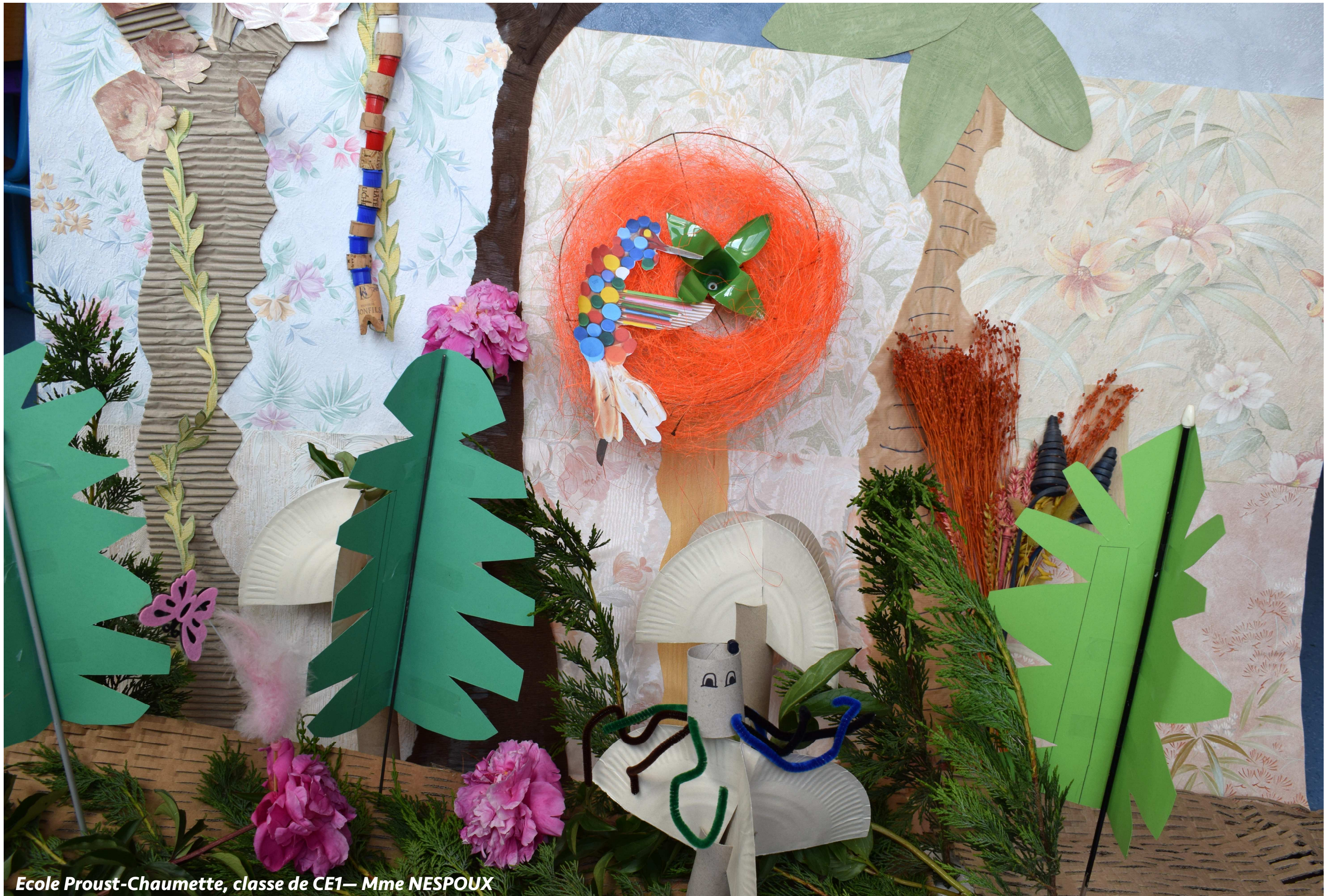
Ecole Proust-Chaumette, classe de CE1— Mme NESPOUX