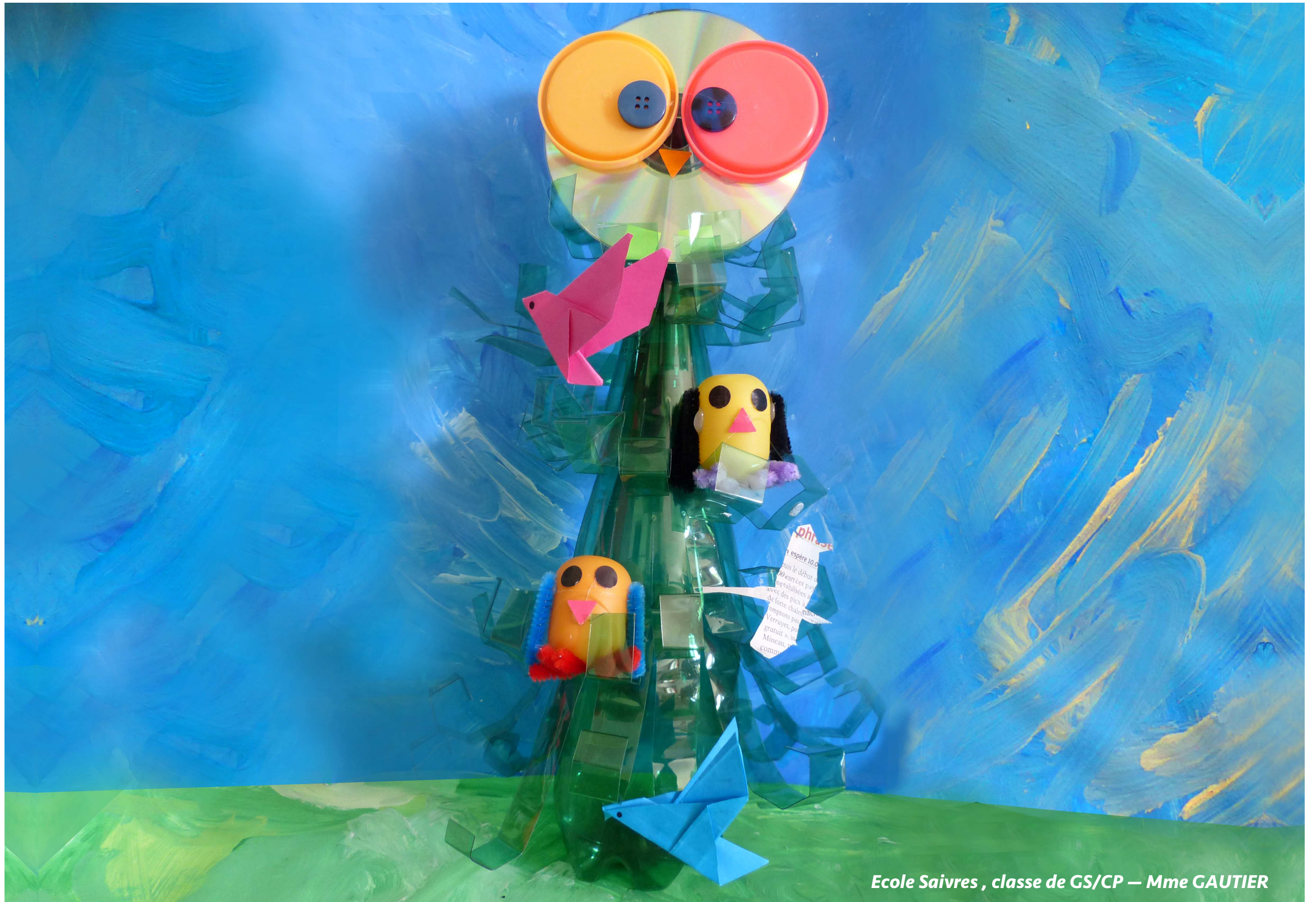
Ecole Saivres , classe de GS/CP — Mme GAUTIER