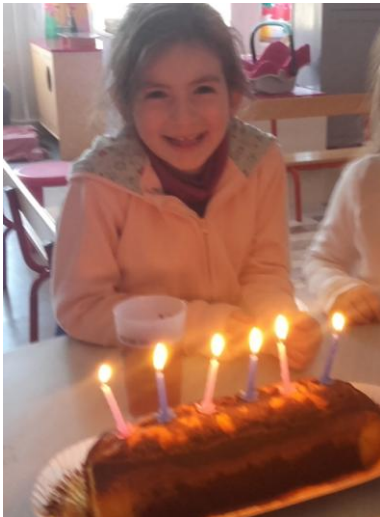
Un matin j'ai vu