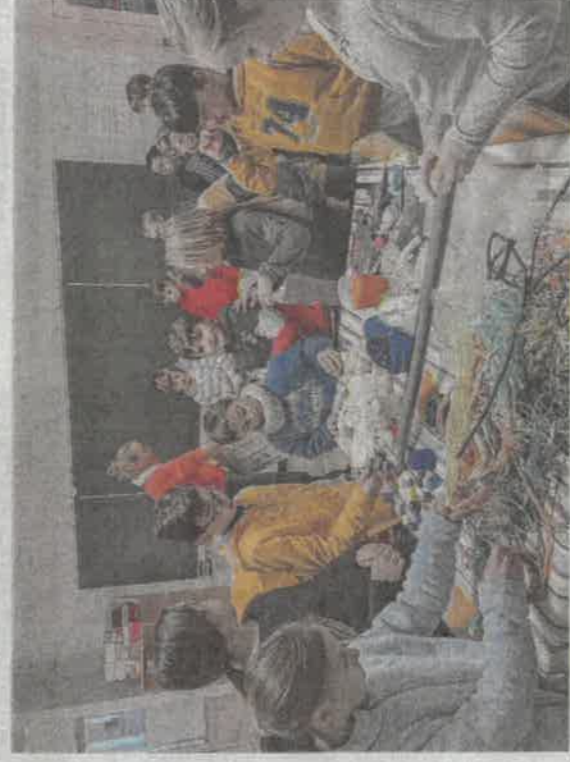
On a vidé les sacs et on s'affaire à trier et classer les déchets. Promis, on viendra voir le résultat.