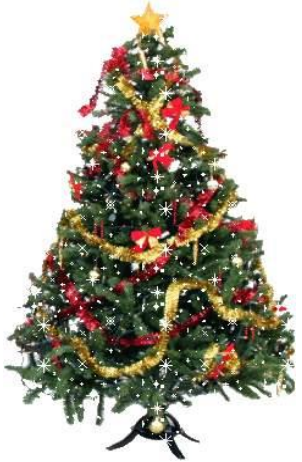
UN SAPIN DE NOËL