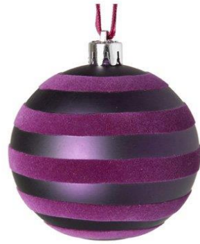
UNE BOULE DE NOËL