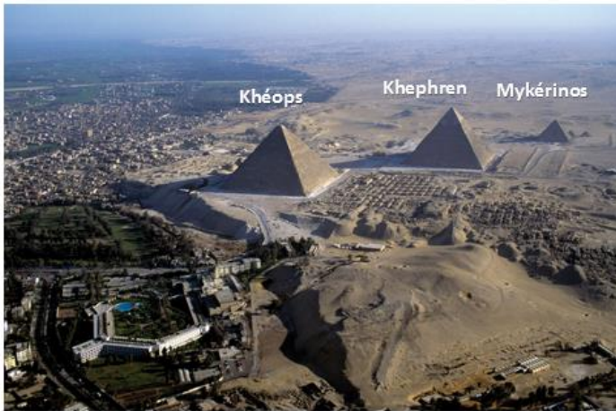
Doc1 : Les pyramides de Gizeh aujourd'hui

A proximité du Caire, sur le plateau de Gizeh, on peut voir aujourd'hui les plus grandes pyramides d'Égypte, et autour, de nombreuses tombes. Construits au III e millénaire avant J.-C, ces tombeaux sont les demeures d'éternité des pharaons et de leur entourage.