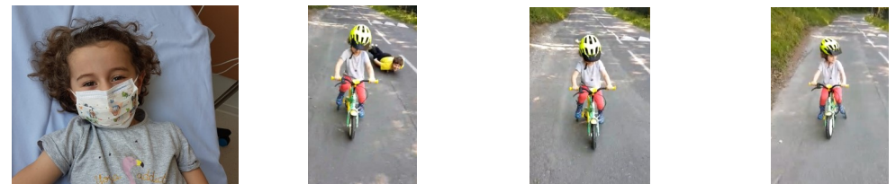
Petite mésaventure pour LOUISE... piquée par une tique.