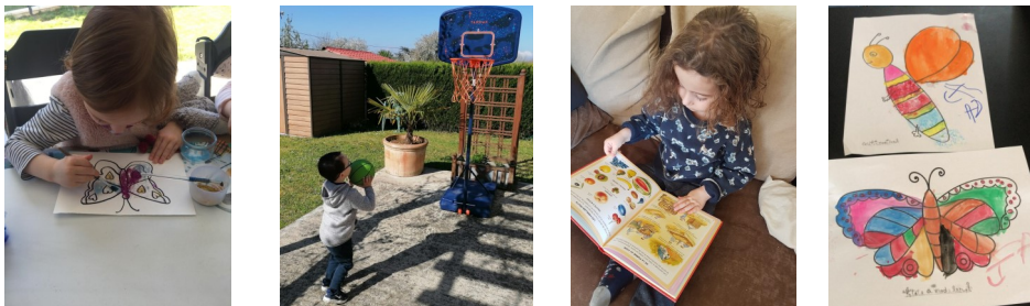
Activités artistiques, sportives, intellectuelles... il y en a pour tous les goûts !