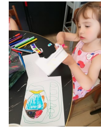
VIOLETTE en train de découper ses poissons d'Avril !