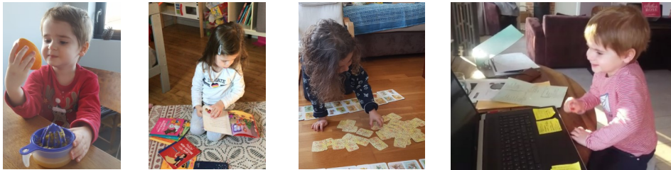
HECTOR qui presse des oranges... histoires à gogo pour CHARLIE, loto pour LOUISE et jeu du petit train pour HECTOR !