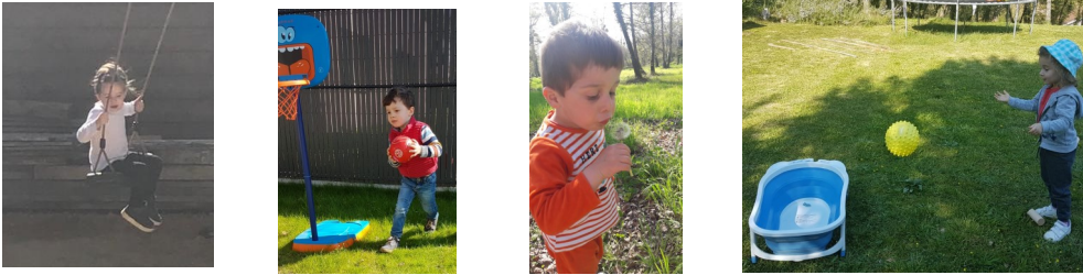
Jeux de plein air pour s'aérer la tête !