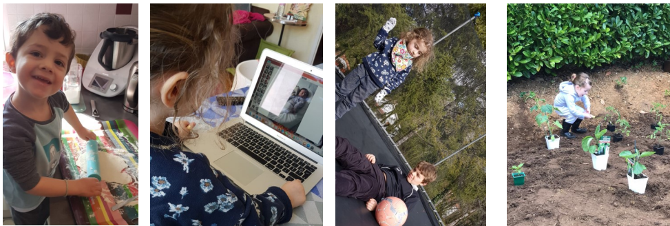
Activité pâtisserie, séquence nostalgie, trampoline ou jardinage...