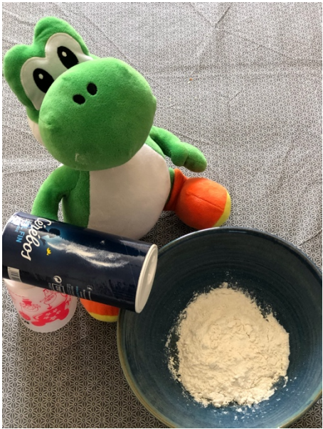
4) _____ _____