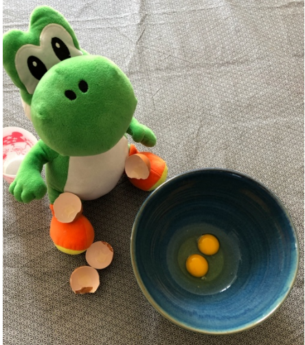
2) _____ _____