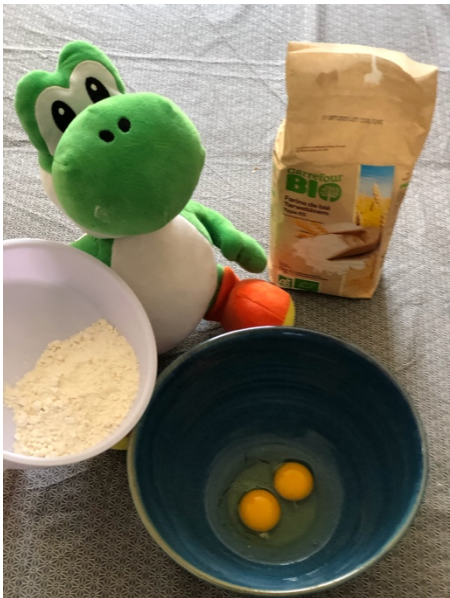
3) _____ _____