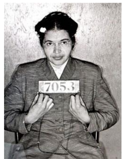
Photo de Rosa Parks lors de son arrestation

Rosa Parks est une couturière noire. A cette époque, les Blancs se mettaient à l'avant des bus et les Noirs à l'arrière. Ils n'entraient pas par la même porte. S'il n'y avait plus de place pour les Blancs, les Noirs étaient obligés de descendre même s'ils avaient payé leur place. Avec ce refus, Rosa Parks est devenue un symbole