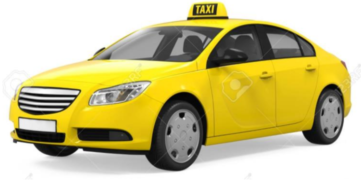
Les taxis de New York