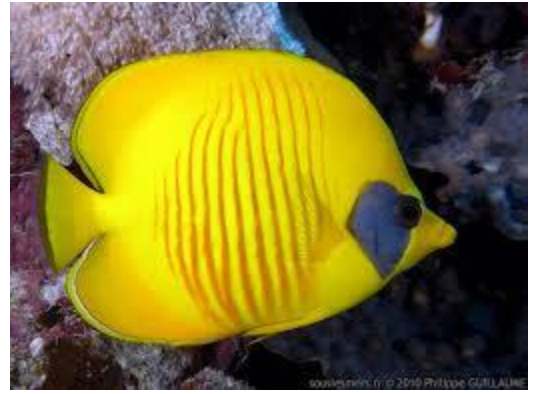
Le poisson papillon