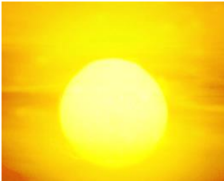
Le soleil en photo