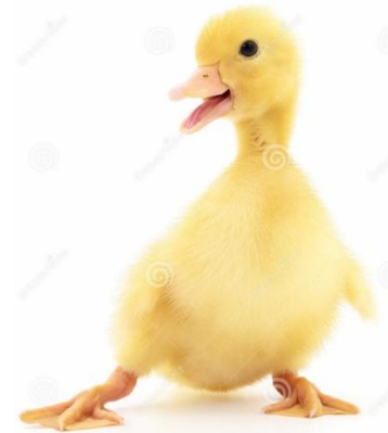
Des canetons (bébé du canard et de la cane)