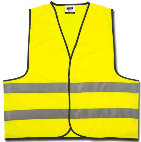
Le gilet jaune dans la voiture à mettre en cas d'accident