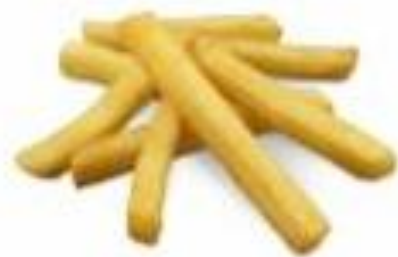
Des frites (c'est fait avec des pommes de terre)