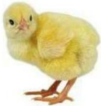
Des poussins (bébé de la poule et du coq)