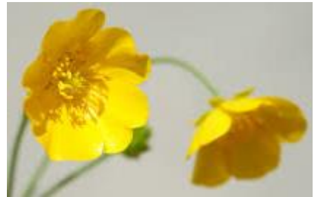
Les boutons d'or