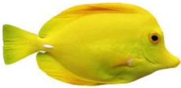
Le poisson chirurgien