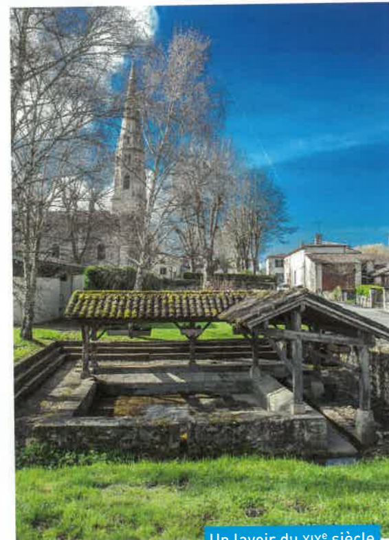
Un lavoir du XIX e siècle

Autrefois, les femmes de ce village lavaient leur linge dans ce lavoir.