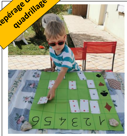
Repérage dans un quadrillage