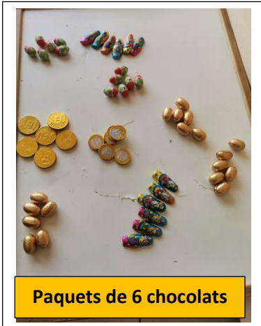
Paquets de 6 chocolats

PRENOM : Louis _____ DATE : _____ 14 Avril _____