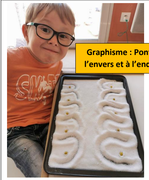
Graphisme : Ponts à l'envers et à l'endroit