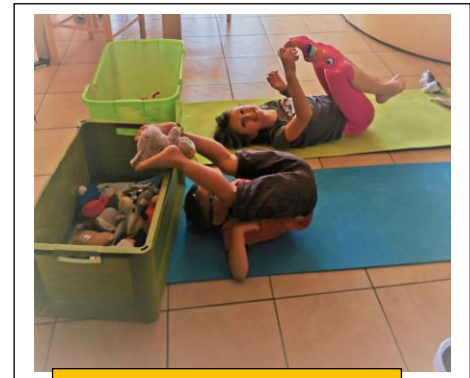
Motricité : mettre les doudous dans la caisse avec les pieds