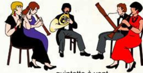
quintette à vent