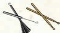
baguettes de percussion