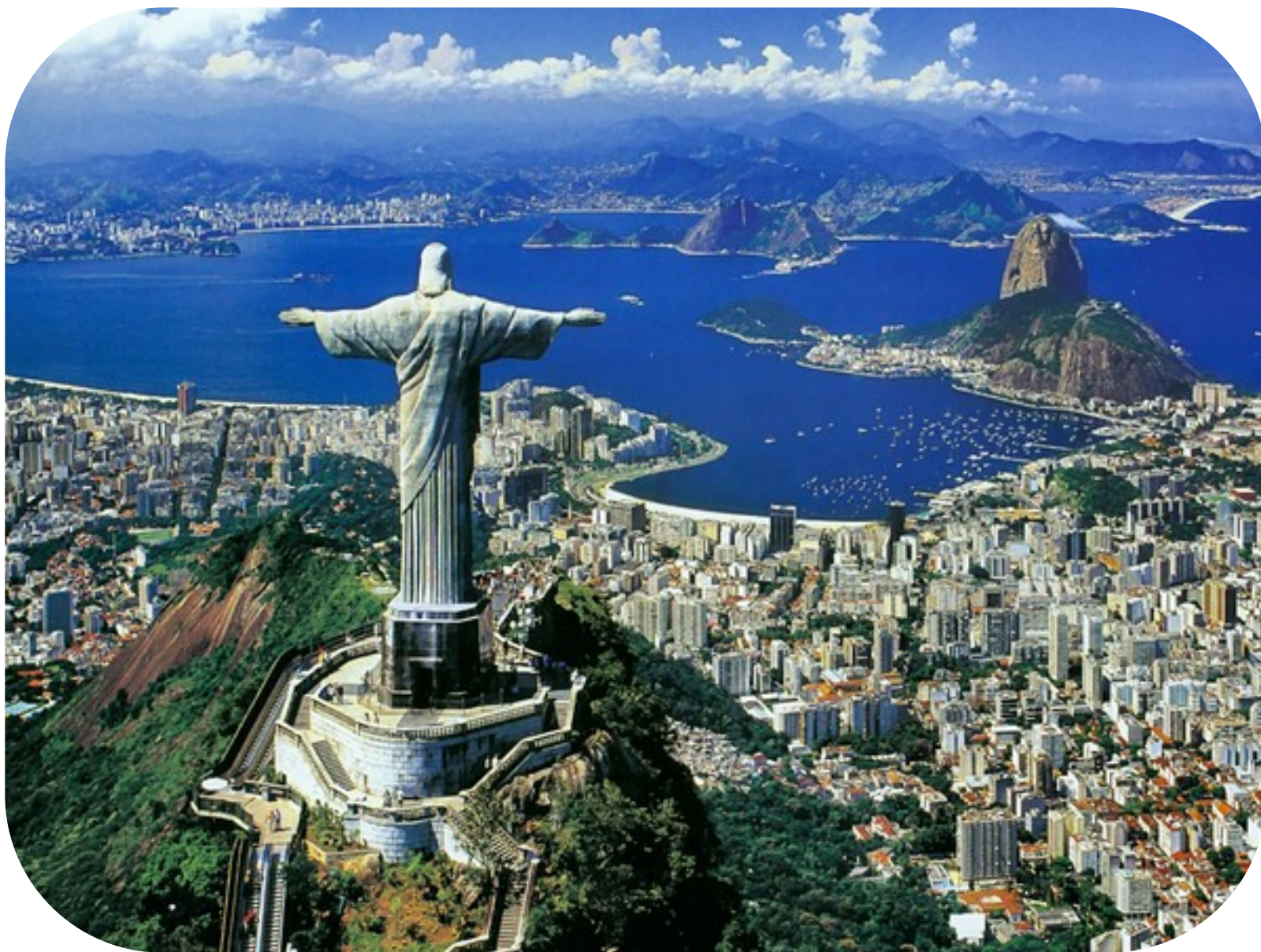
Rio de Janeiro.