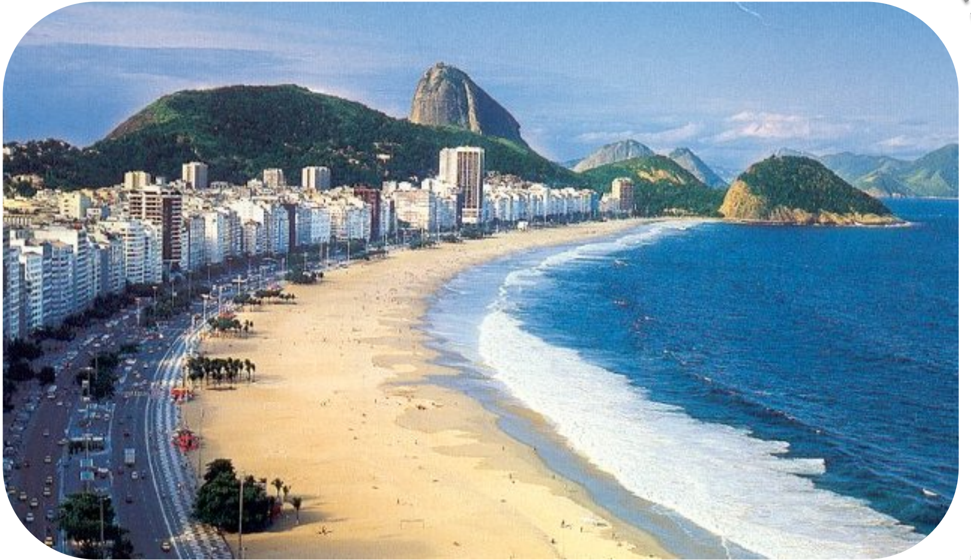
La plage de Copacabana