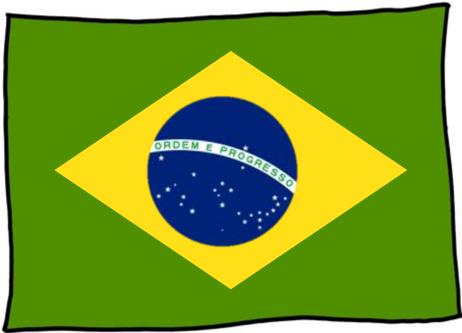
Le drapeau du Brésil