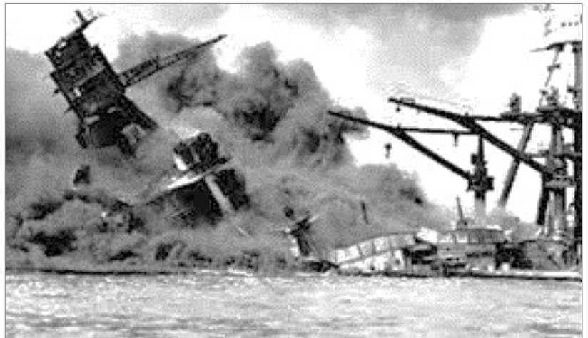
Doc 3 : L'attaque de Pearl Harbor

Comment les japonais ont-ils attaqué les américains ? Par bombardements