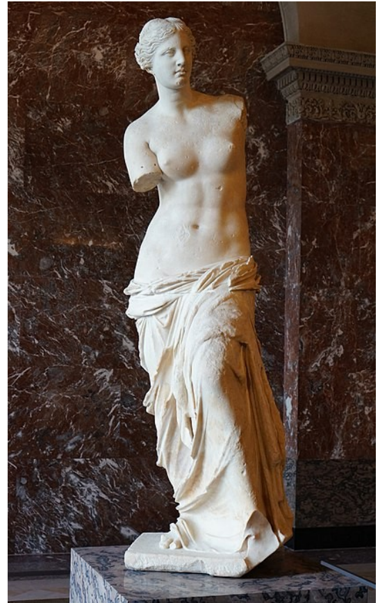
La Vénus de Milo 150 – 130 av JC (Louvre)