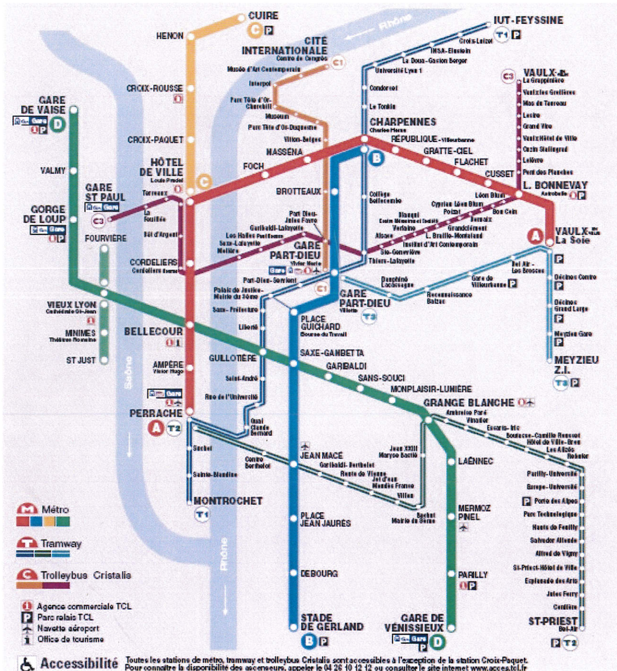
Doc 1 : Le réseau des transports en commun lyonnais

Le réseau de transports urbains de Lyon est constitué de :