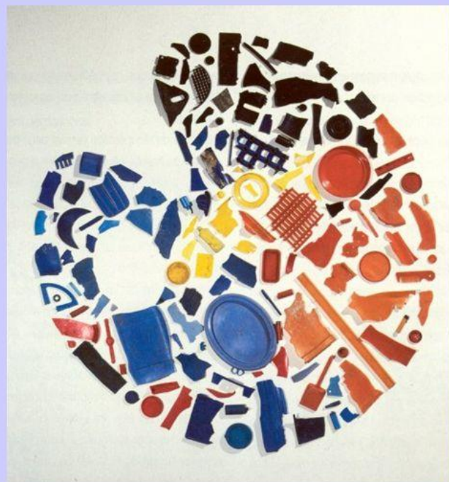
Tony Cragg, Palette, 1985

Tony Cragg a utilisé des objets de la vie quotidienne en plastique de couleur pour créer la forme d'un autre objet. En faisant cela, il veut montrer que les matériaux des artistes d'aujourd'hui sont les vrais objets du quotidien.