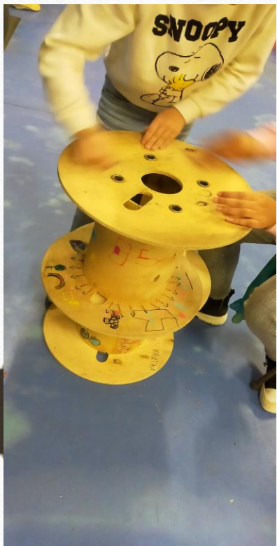
Ponçage et décor de touret