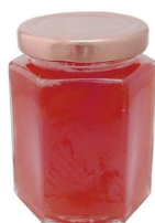
de la confiture