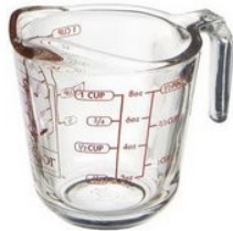
un verre mesureur