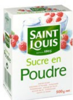
du sucre en poudre