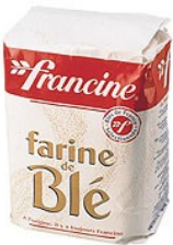
250g de farine