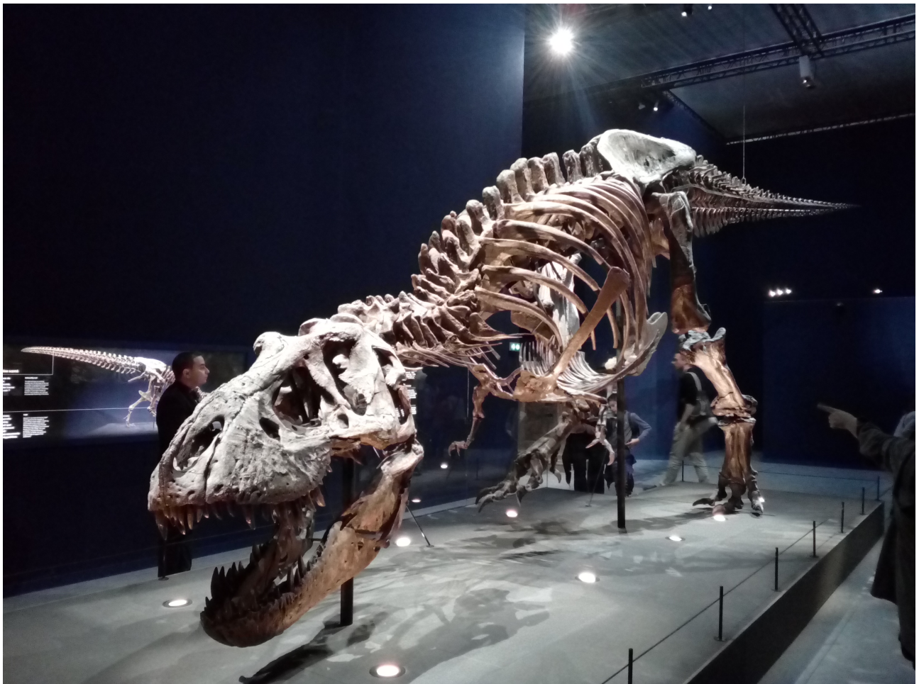
Et voici TRIX le squelette de T-Rex mascotte de l'exposition complet à 75 % et qui mesure 12,5m de longueur.