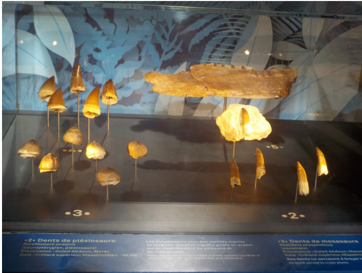
Des dents de reptiles marins