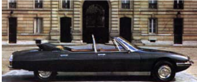
La SM présidentielle