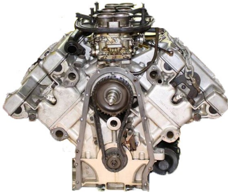
Le moteur de la SM, le fameux six cylindres en « V »

Cette voiture devait atteindre les 200km\h, vitesse importante pour l'époque. Le gros moteur de cette Française d'exception est un six cylindres en « v » inspiré du huit cylindres de la Maserati Indy.