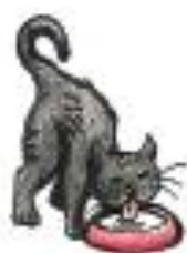
Un chat noir boit du lait.