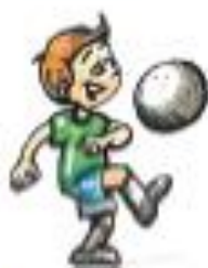
Un garçon joue au ballon.