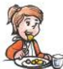
Une fille mange.

2. Sur un cahier, écris une phrase pour chaque dessin :