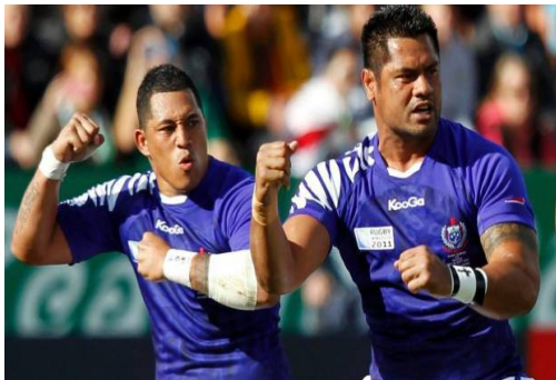
Les samoans font le Haka