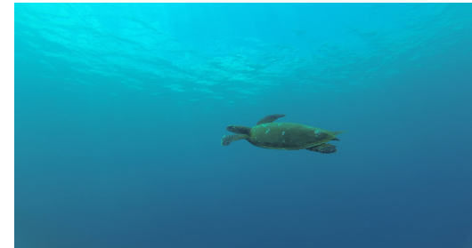
voici une tortue