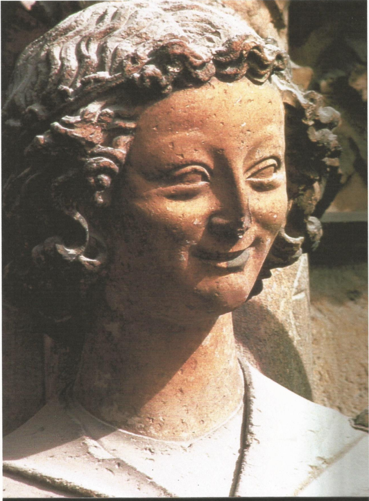
L'ange Gabriel, Cathédrale de Reims