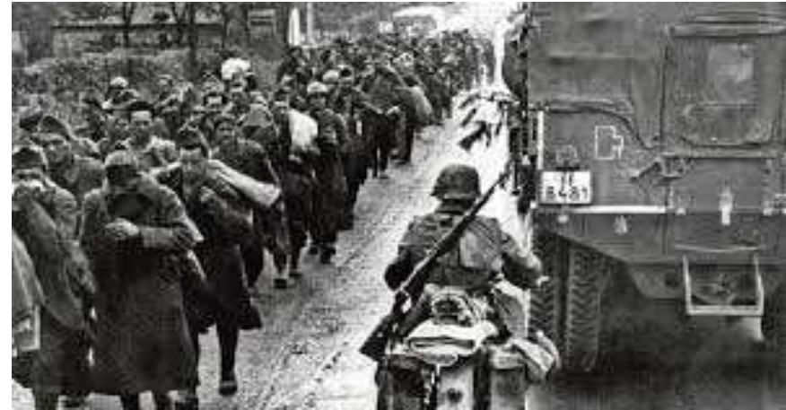
Les soldats français sont capturés.

Fin mai début juin des soldats britanniques sont évacués vers l'Angleterre à Dunkerque.