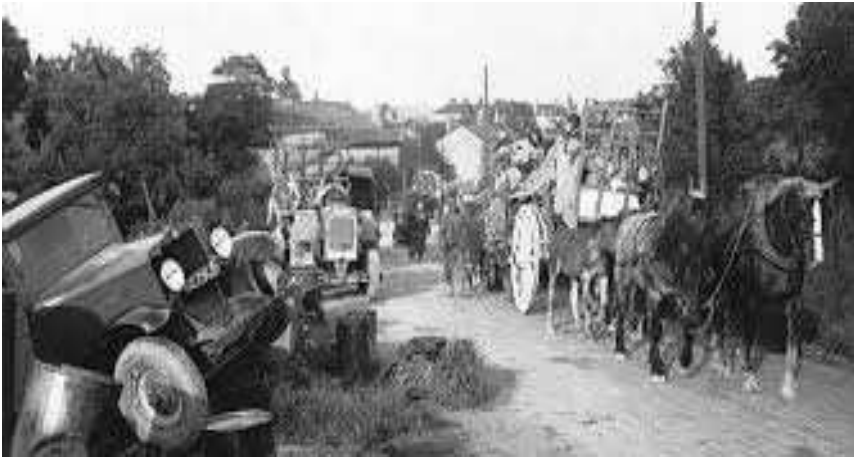
Les civils français du nord fuient.