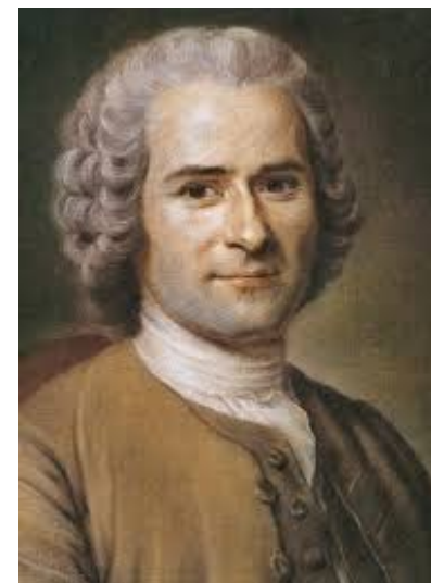
Rousseau 1712-1778 ( égalité des hommes)

Des écrivains philosophes célèbres critiquent la société et le Roi.