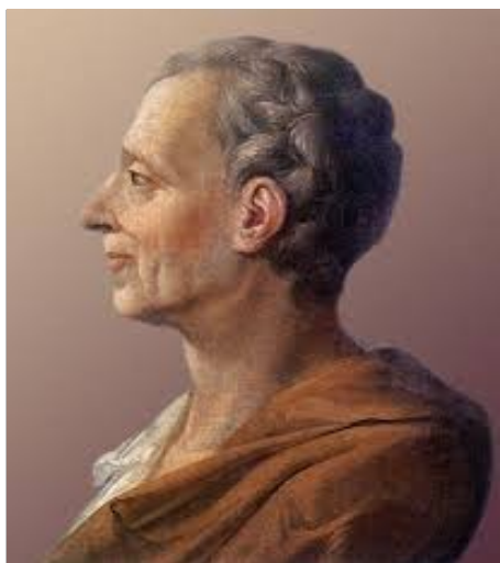
Montesquieu 1689-1755 (séparation des pouvoirs)

Des écrivains philosophes célèbres critiquent la société et le Roi.