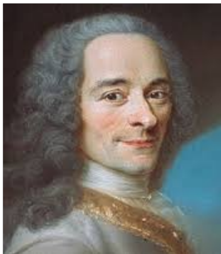
Voltaire 1694-1778 ( liberté de penser )