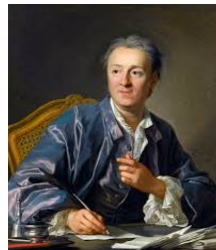
Diderot 1713-1784 (l'encyclopédie des connaissances)