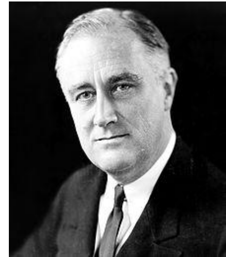
USA : Roosevelt