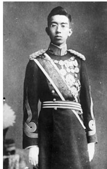
Japon : Hirohito