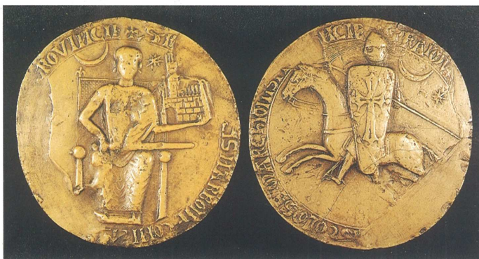
Sceau et contre-sceau de Raymond VI, comte de Toulouse, 1207

Comité départemental du tourisme Conseil général de l'Aude, 11885 Carcassonne CEDEX 9, tél. : 04 68 11 66 00, fax 04 68 11 66 01, email : cdt.aude.pays.cathare@wanadoo.fr