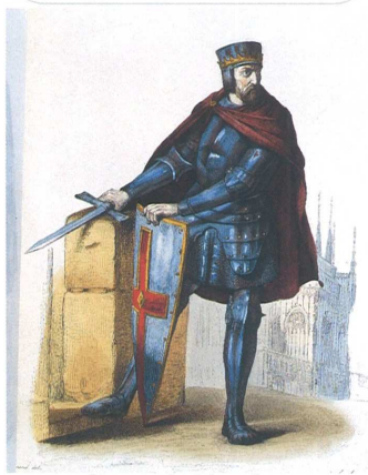
Simon de Montfort

Seigneur français ayant participé à la quatrième croisade en Terre Sainte, il prit ensuite la tête de la croisade contre les Albigeois qu'il battit à Muret en 1213. Il fut tué en faisant le siège de Toulouse en 1218.