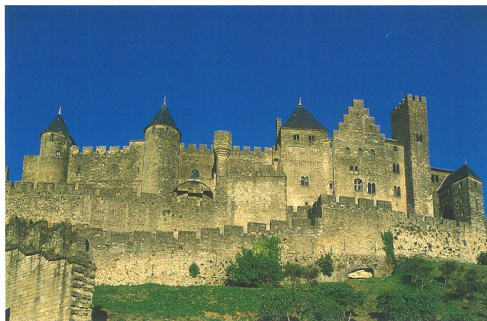
La cité de Carcassonne