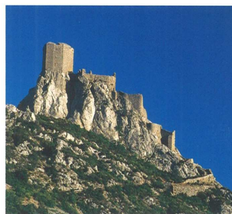
Forteresse de Quéribus

Pour venir à bout de cette hérésie cathare qu'elle veut détruire, la hiérarchie