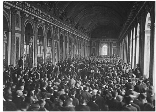
Doc C : Le traité de Versailles

Le traité de Versailles est signé le 28 juin 1919 dans la galerie des glaces du château. Il marque les conditions de la paix et rend l'Allemagne seule responsable de la guerre. Le traité impose à l'Allemagne de lourdes sanctions qui seront à l'origine de la montée du nazisme dans ce pays.