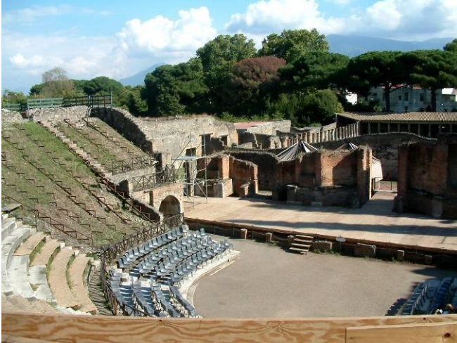
Le grand théâtre de Pompéi, aujourd'hui.

Les bâtiments, les constructions, les rues : tout était resté à la même place que lors de ce tragique mois d'août de l'année 79.