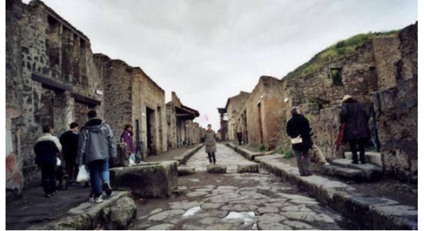
Une rue de Pompéi, aujourd'hui.

Parfois, les corps des victimes , recouverts par la cendre, ont laissé leur empreinte dans la couche. Les historiens ont alors réussi à effectuer des moulages de ses corps en plâtre, tel qu'ils étaient lorsqu'ils se sont fait prendre par les cendres.