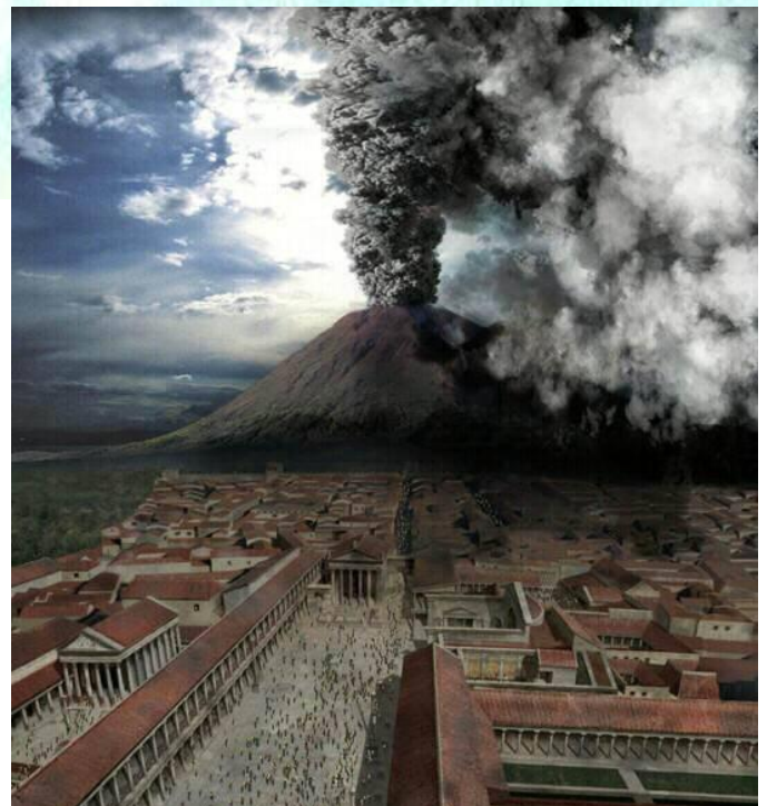
Reconstitution de l'éruption du Vésuve, Discovery Channel.