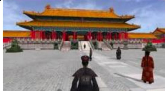
La cité interdite