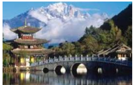
Vue sur l'Himalaya