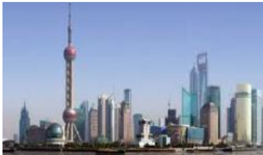
Grande ville : Shangai