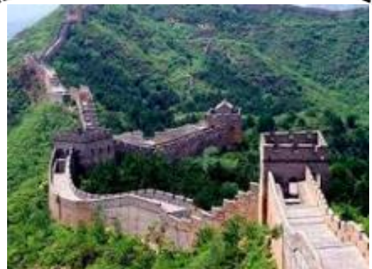
La muraille de Chine