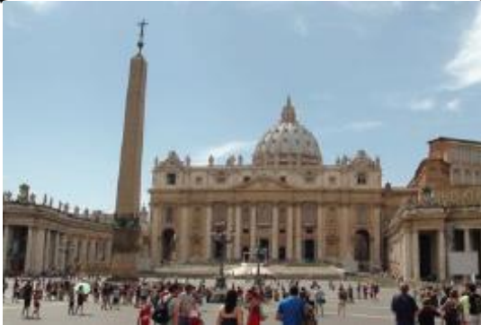
La Basilique Saint Pierre