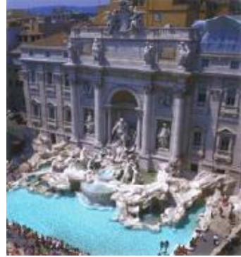
La Fontaine de Trévise