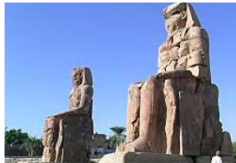
Les colosses de Memnon