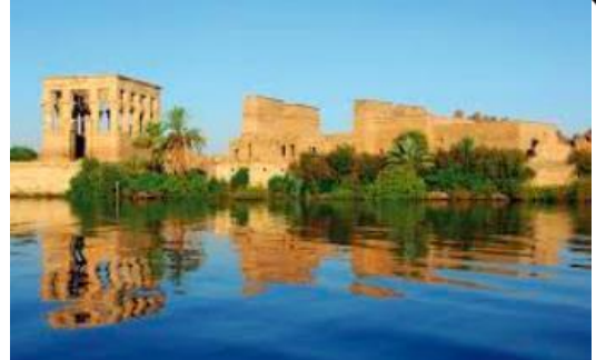
La vallée du Nil