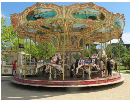
Le manège place de la Brèche