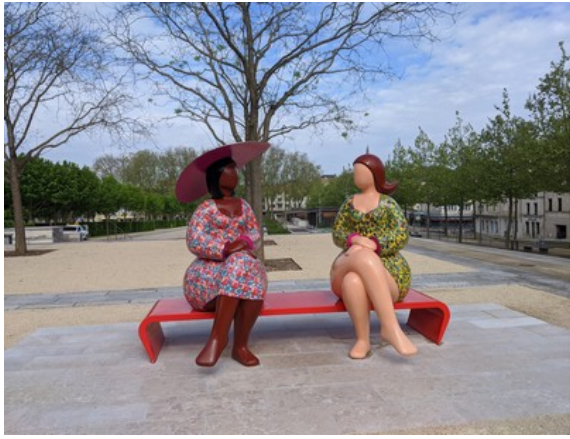
Les grosses dames de La Brèche