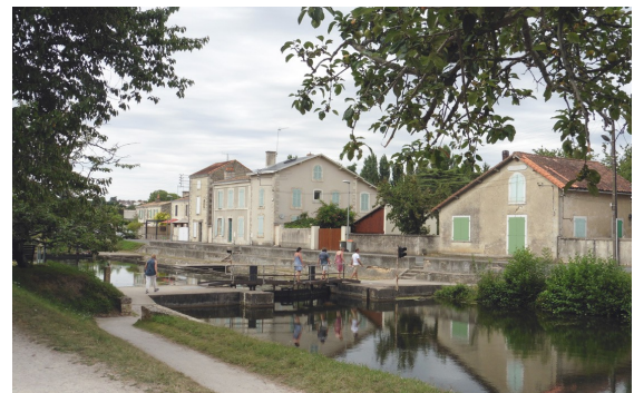
L'écluse de Comporté