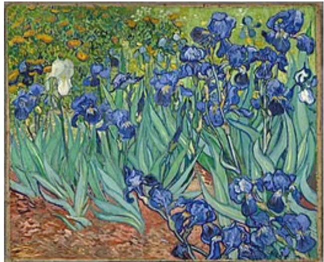
Les iris de Van Gogh

Tu sais Van Gogh, c'est le peintre qui a fait les bouquets de tournesols regardés à l'école.