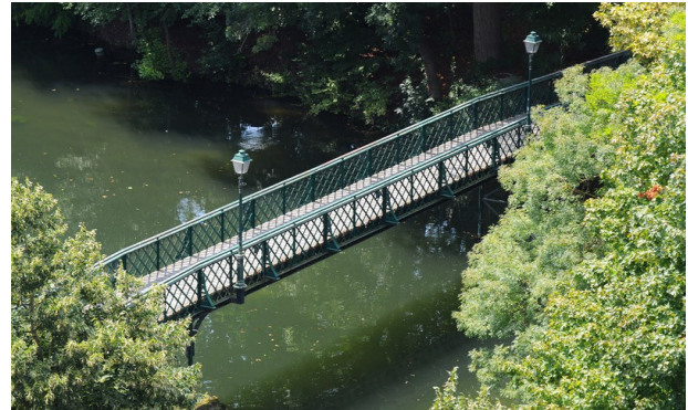
La passerelle du Moulin du Roc