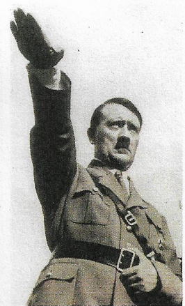
Mussolini, Staline et Hitler

● Quels points communs vois-tu entre ces différents dictateurs ? (vêtements et attitude)