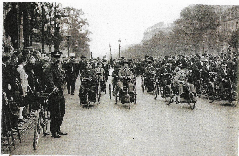
Un défilé d'invalides de guerre dans les années 1920

● En observant ces deux documents, décris l'état de la France à la fin de la Première Guerre mondiale.