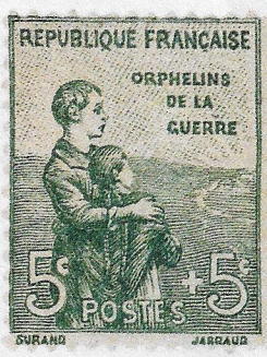
3 Les orphelins de la guerre

Les personnes âgées se remettent au travail. Beaucoup d'enfants ne fréquentent plus l'école régulièrement, en particulier dans les campagnes où ils participent aux travaux des champs. Les civils sont violemment confrontés à la mort : près d'un million d'enfants perdent leur père pendant la guerre. Près du front, ils vivent également au milieu des bombardements qui frappent villes et villages. Toute la population subit la propagande de guerre, qui cherche à motiver chacun au combat pour assurer la victoire.