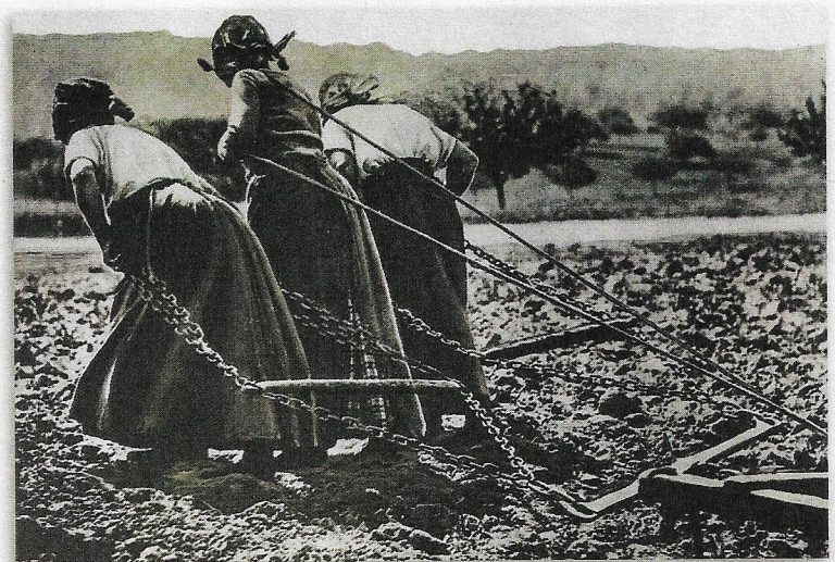
1 Des femmes aux travaux des champs

Les femmes deviennent un indispensable soutien à l'effort de guerre : elles fabriquent des armes, s'occupent des tâches administratives et conduisent les véhicules. Dans les campagnes et dans les villes, elles occupent le travail des hommes partis au combat. Elles effectuent les travaux agricoles, soignent les blessés qui arrivent par milliers dans les hôpitaux ou partent comme infirmières sur le front. Les « mairaines de guerre » écrivent aux soldats, leur envoient des colis pour les soutenir et les encourager. Celles qui travaillent dans les usines d'armement sont appelées les « munitionnettes ». Elles fabriquent en 4 ans plus de 300 millions d'obus et 6 milliards de cartouches.