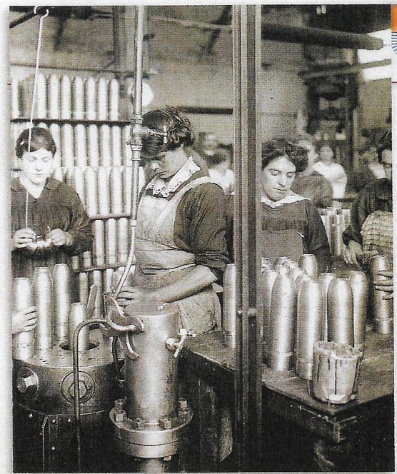
2 Des femmes dans une usine d'armement

● Quel travail ces femmes effectuent-elles ?